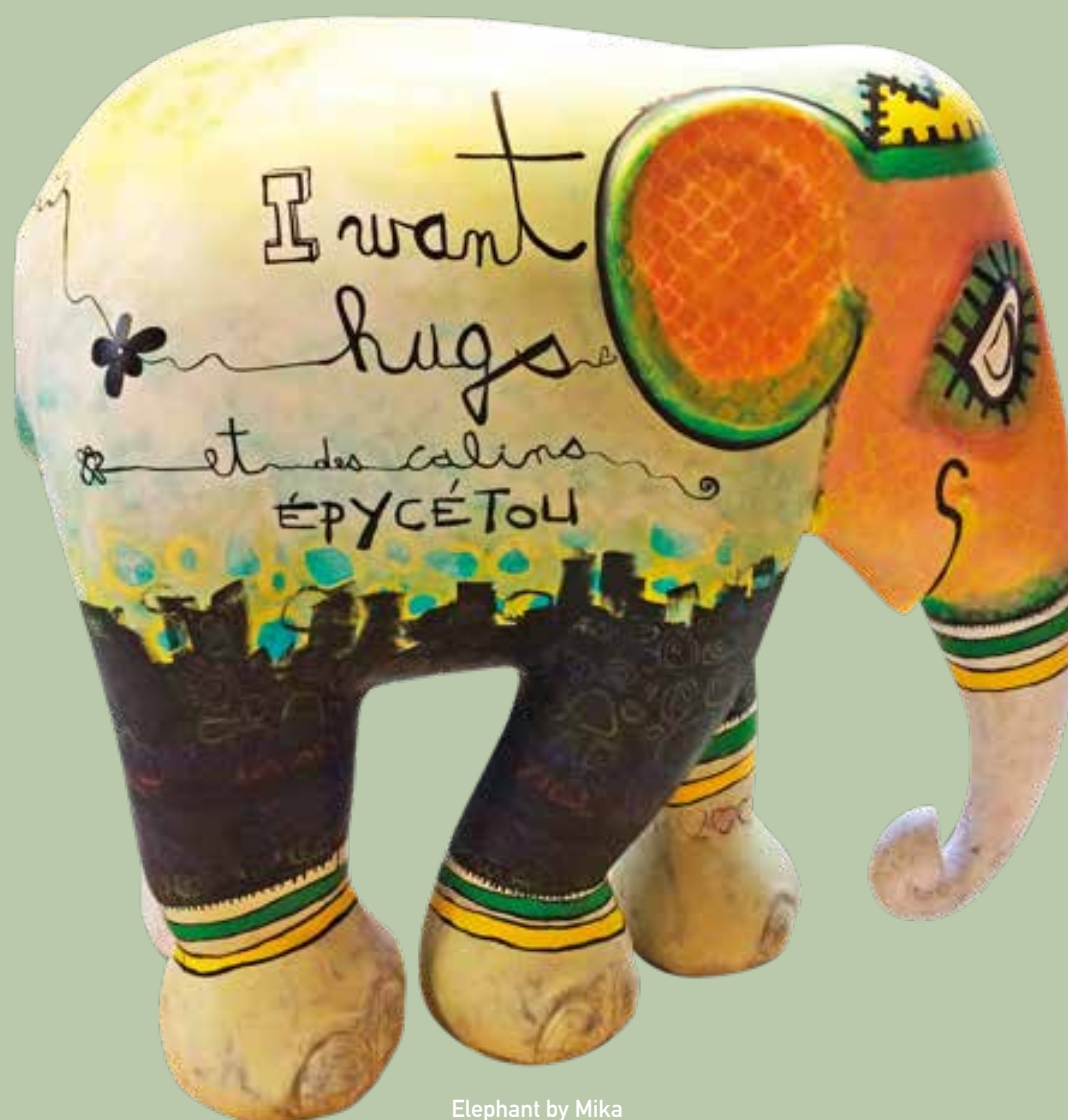
Elephant by Mika

Heihof Goed Gezond Gewicht is onderdeel van Kliniek Heihof