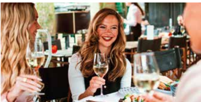
Diner voor twee bij Nannes of Rex