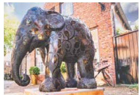
Foto op dibond in de maat 80 x 120 cm door fotograaf Paul Eertman, gemaakt tijdens de parade in Twente 2021. Paul Eertman was overigens zo enthousiast over Elephant Parade dat hij zelf ook een olifant heeft ontworpen.